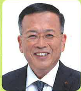
公明党横浜市議員団