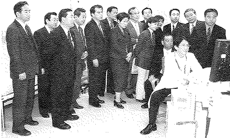
市立みなと赤十字病院アレルギーセンターを視察する公明党横浜市議員団

昨年7月、横浜市立みなと赤十字病院に開設されたアレルギーセンターでは、子どもから成人までのさまざまなアレルギー疾患に幅広く対応するため、アレルギー科や小児科、皮膚科、呼吸器科、耳鼻咽喉科、眼科、内科の各科で専門医によるアレルギー診療を実施。複数症状の併発が多いアレルギー疾患に総合的な対応を行う先進的な取組が注目されています。