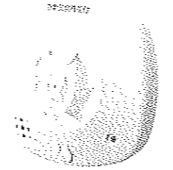
住宅用火災警報器

住宅用火災警報器が、法令によりすべての住宅に設置が義務付けられました。 ▼ いつから義務化になるの? 新築住宅は平成18年6月1日から、既存住宅は平成23年6月1日までに設置が必要です。 ▼ 住宅用火災警報器とはどんなもの? 煙や熱を自動的に感知し、音や声により、火災の発生を知らせます。 ▼ どこに付けるの? 寝室、避難する階段、台所が義務化されます。 ※高齢者世帯には補助制度があります。(各種条件あり) 【お問い合わせ先】消防局 予防課 電話 045(334)6602