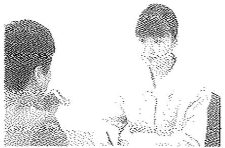
相談窓口の充実を図ります

○「地域連携少額対応資金」 少額な借入資金を、地域金融機関と連携し、手続きの簡素化・審査期間の短縮・第三者保証人が不要な利用しやすい融資で支援。 ○「ものづくり支援資金」 中小製造業のものづくりの活性化を支援。 ○「IT化対応ビル整備支援」 業務機能の集積促進を図るため、業務ビルのIT化対応の整備を支援。 【お問い合わせ先】経済局 経営金融課 電話 045(671)29602