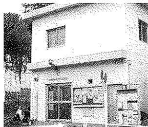
いつでも「おまわりさん」のいる交番に

平成17年度は、神奈川県内に240人の警察官が増員され、交番相談委員も神奈川県内に150人、(うち横浜市は68人)増員されます。これにより市内で220か所ある交番のうち130か所に交番相談員が配置されることとなります。今後も引き続き空き交番の解消を目指します。