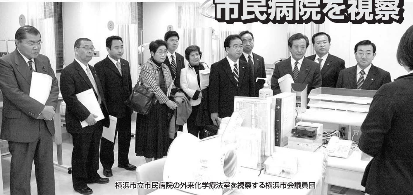
横浜市立市民病院の外来化学療法室を視察する横浜市議員団