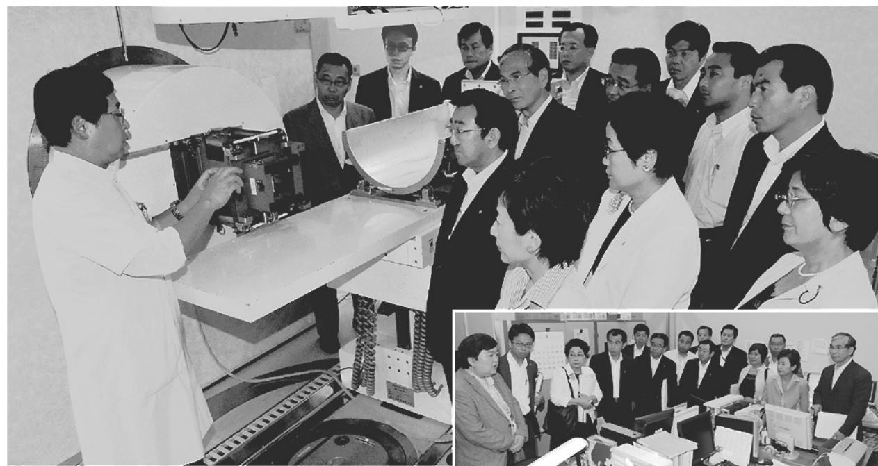
重粒子線治療装置を視察する横浜市会議員団