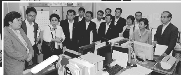
千葉県立がんセンターでがん登録の説明を受ける横浜市会議員団